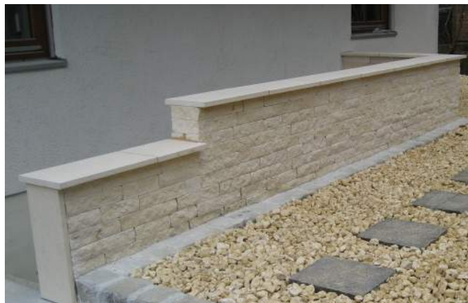
Kalkstein Mauerverblender und Abdeckplatte verklebt und verfugt