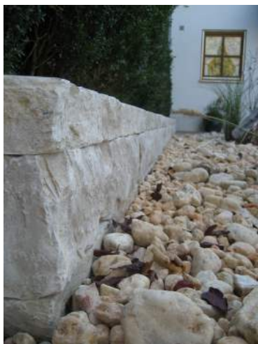
Kalkstein Rebmauer verklebt

ALLES miteinander verkleben, montieren und abdichten. Nachfolgend ein paar Anwendungsbeispiele im GaLaBau.