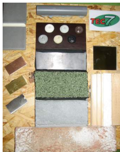
Klebe- und Verfugungsbeispiele. ALLES ist mit- und untereinander verkleb- und verfugbar.