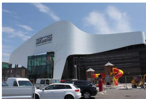
Und auch das leistet TEC7. Metallfassade komplett geklebt