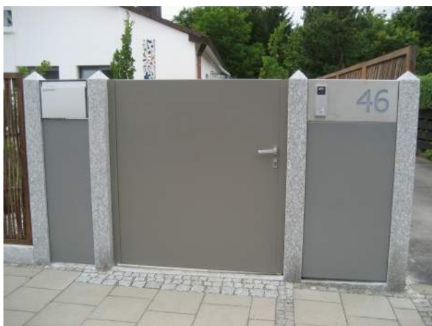
Metall Füllplatten, Briefkasten und Klingelkasten an Granitstelen verklebt